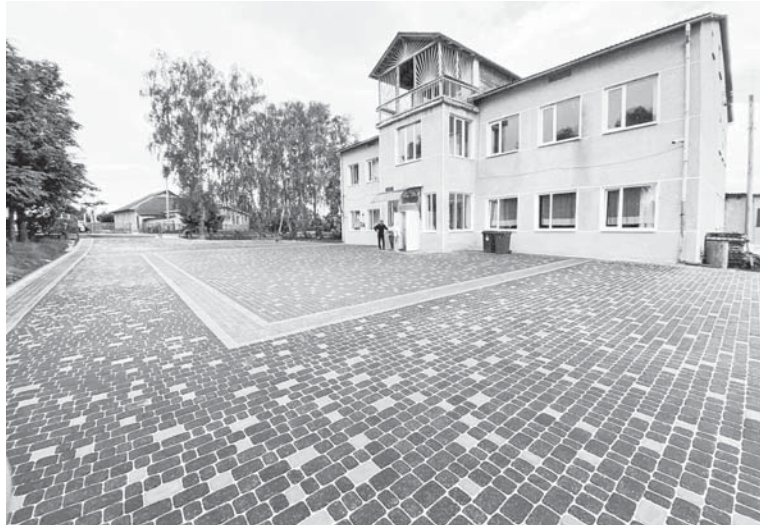
Ось яким стало шкільне подвір'я в Драгомирчанах

До речі, третину тротуару на Шкільній зробили завдяки минулорічному «Бюджету участі», на який у 2023-му подавалися і теж виграли. Коли профінансують цьогорічну ініціативу (її бюджет складає 500 тис. грн), а ще виконає обіцянку зробити фрагмент тротуару біля своєї території завод мінеральних вод «Девайтс» – то вся вулиця матиме добрий хідник.