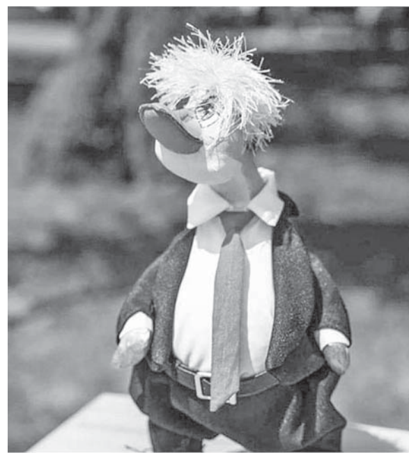
Лялька качка Джонсон