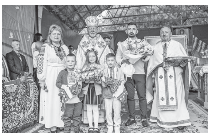
Фото святкування 7 липня 2023 р.