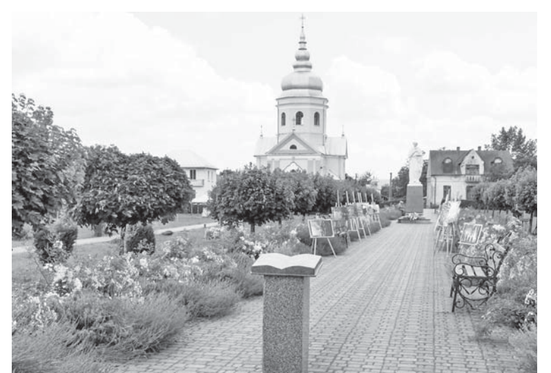
Біблійний сад у Маріямполі