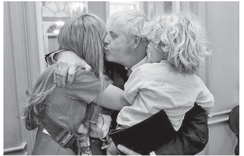
Джонсон батько і чоловік